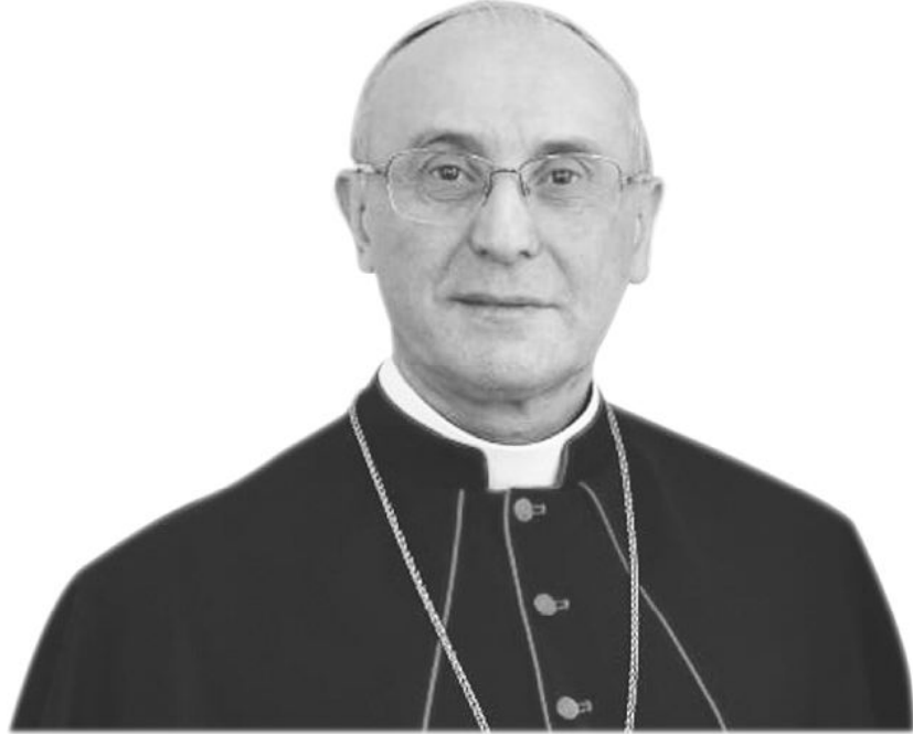
Archbishop Leopoldo Girelli Apostolic Nuncio - India